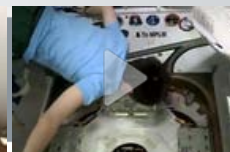
Iss: Cristoforetti, "che odore ha lo Spazio? Un mix di puzza di bruciato e stantio..."