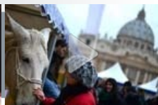
Animali in Piazza San Pietro: si festeggia Sant'Antonio