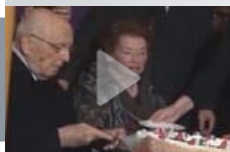
La festa nel quartiere Monti per il ritorno di Napolitano e Clio